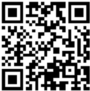
問卷 QR Code

問卷網址： https://www.surveycake.com/s/dMK0B