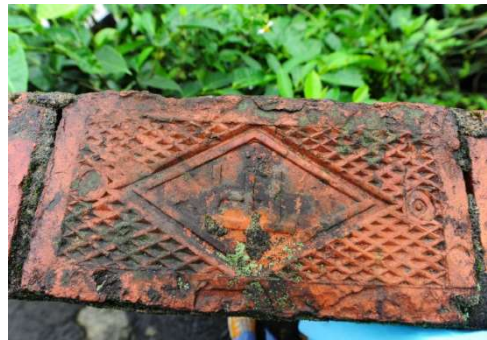
TR磚 網站連結: http://gg.gg/nqbi3

許梓桑古厝位於基隆市仁愛區愛四路2巷15號，是個中西式混合的建築，採用TR磚，樓上兩層磚牆結構還有地下室，傳統閩和臺灣煉瓦所生產的磚塊，一級品會印有「TR」福州杉建材，TR紅磚是台灣煉瓦株式會社的縮寫商標其又被稱為「TR磚」，地在的字樣，TR為台灣煉瓦(Taiwan Ren)閩南三合院式建築外形也像是日式洋樓，裝飾有牛眼窗、竹飾等等，大門正廳兩側各有一個設計放置在接近屋頂的山牆頂端，用意在於裝飾單調的牆面。許梓桑古厝所在的位置，日治時期稱為少將山，因昔日建有基隆要塞司令官邸且多為少將以上軍職，所以故有此稱。