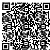
Sony Taiwan CSR 官網

(一) 報名：至 Sony Taiwan CSR 官網填寫書面資料報名初審，主辦單位將根據團隊撰寫資料選出 105 組隊伍進入複審，將於指定時間公告於 Sony Taiwan CSR 官網並 email 通知入選團隊，未入選者恕不另行通知。