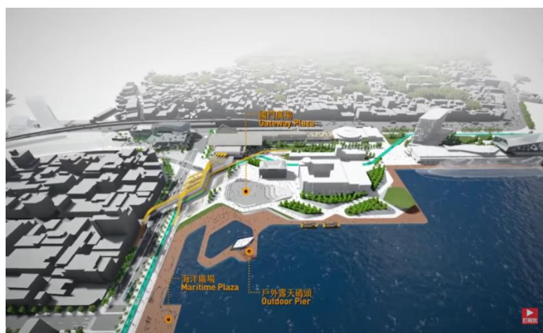
未來海洋廣場的設計圖，如圖，設立戶外露天碼頭等設施

未來的基隆再生計畫，含蓋層面，包含成立基隆都市更新專案辦公室、城際轉運站、新火車站北口廣場規劃、東櫃西遷、多功能郵輪中心開闢等計畫，期望的海洋廣場為設置戶外露天碼頭、水上巴士、並且打造創新生態系。