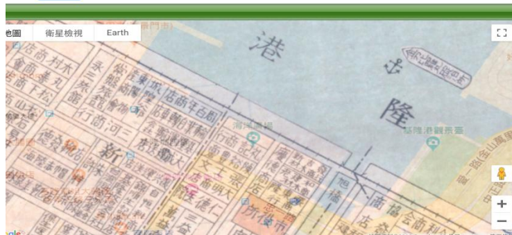
1921 年的海洋廣場，當時已是商店街

基隆市海洋廣場今日為基隆的觀光聖地，位於基隆市仁愛區中正路與基隆港間，是在前政務委員林盛豐的努力之下舉辦 2008 年觀光客倍增計畫，為改善台灣觀光環境，落實「觀光生活化、生活觀光化」，提升品質，成為基隆特色，計畫海洋廣場。海洋廣場在 2009 年 7 月開工，8 月 19 日啟用，並且於 2013 年 2 月打造造型觀景台，2016 年 1 月修補破損並將平台下才改為不鏽鋼、增設排水孔。