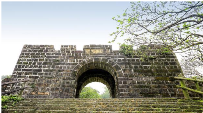
刻有「海門天險」四字的城門 (上圖)

市府將推出「希望之丘」的計畫，以海門天險為起點結合未來將變成為都會公園的中正公園。海門天險在二沙灣山的中心點，也是基隆最具有代表性的國定一級古蹟，但經過戰火摧殘後，現在已經沒有軍事用途了。中正公園改造要點:去年市政府開始實施希望之丘的整體計畫案。除了此計畫外，市政府也在規劃的「基隆嶼海上公園」，不但可以坐船遊覽，也可以搭乘直升機俯瞰，本市觀光旅遊發展將漸入佳境，值得期待。而基隆將創造成觀光重鎮。在文化發展上則是為了傳承地方文化特色，而市政府將整理市內古蹟，並設立解說牌導覽，有助於青少年學習該地那曾經輝煌的歷史。