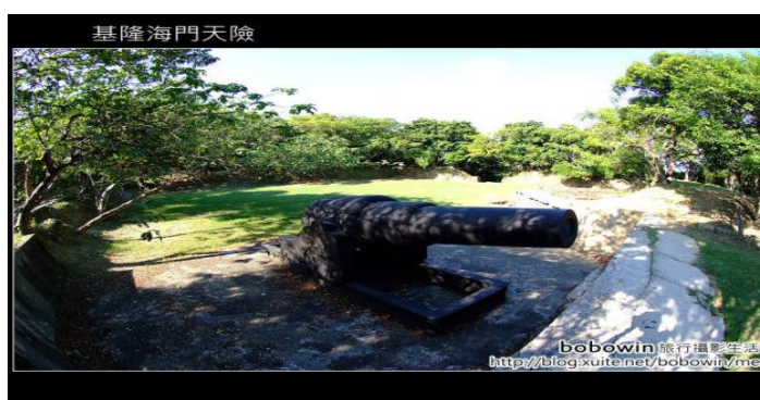
海門天險的(二沙灣)砲台 (下圖)