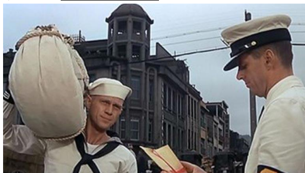
↑ 1966 年聖保羅砲艇電影部分片段所拍到的林開郡洋樓