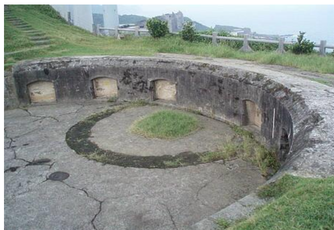
圖-3 白米甕砲台 砲盤區放彈藥處