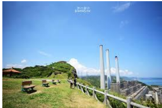
圖-2 白米甕砲台緊鄰協和火力發電廠