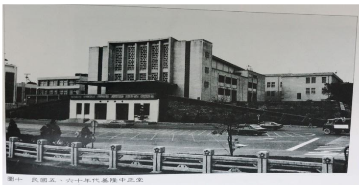
日治時期的文化中心

日治時期初期，日本統治當局在基隆港邊的哨船頭山建基隆公會堂為臺灣第一座公共集會設施。1945年進入中華民國時期後，為了配合行政院在 1980 年改建為基隆市立文化中心。1985 年 8 月 27 日，基隆市立文化中心落成。1988 年 6 月基隆市立文化中心一樓餐廳拆除改設基隆市史蹟館。1989 年 3 月，基隆市立文化中心二樓期刊室移至三樓，規劃籌設視聽中心。1990 年 2 月基隆市立文化中心視聽中心完工對外營運，原基隆市立文化中心館改名為基隆文化中心。