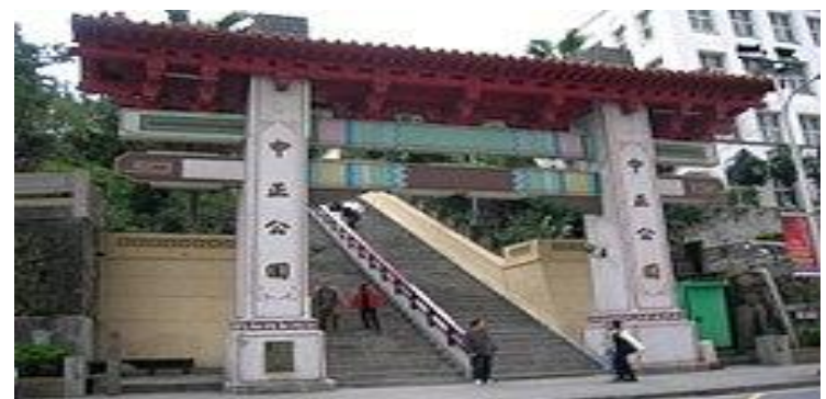
圖三 現在中正公園以及前往基隆忠烈祠的出入口樣貌

現今忠烈祠由基隆市政府機關管理，用來供奉為中華民國獻身的人民，例:抗日英雄、二次世界大戰為國捐軀之人、協助中華民國軍隊的百姓、警察、以及消防員等。