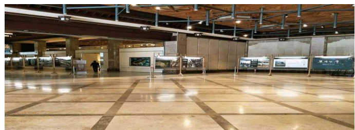
現在文化中心的內部構造