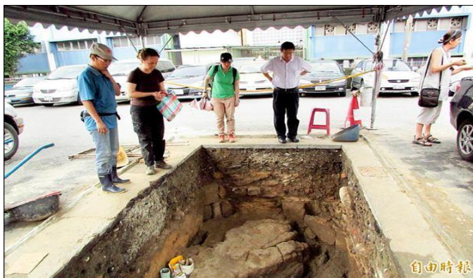
考古團隊在和平島發現西班牙教堂基礎[ http://gg.gg/g719s ]

今年挖出十具骨骸，清楚看出有的雙手交握胸前，像是在祈禱，加上先前挖的共有十五具，已確認這裡就是教堂遺址。