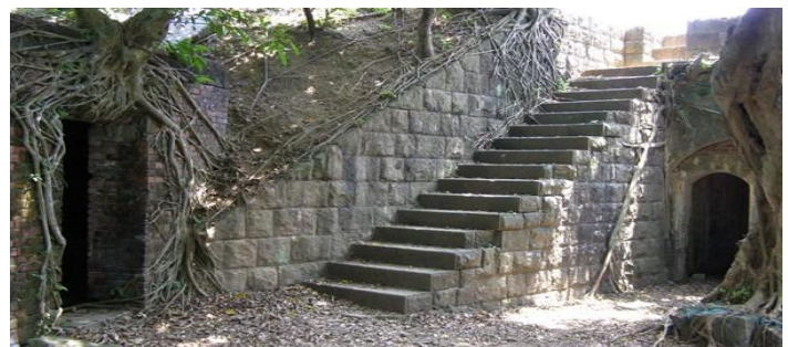
社寮東砲台為西班牙與荷蘭人最早的戰爭根據地

社寮東砲台的歷史最久能追溯到荷西時期，最早為西班牙與荷蘭人的戰爭根據地，於 1626 年即開始建立砲台，清帝國時期時是清法戰爭的戰備砲台，1886 年劉銘傳先生再度興建社寮砲台；日治時期之後，由總督府築城部的基隆支部於 1901 年 } 開始改建，1903 年完工，1907 年又改建社寮砲台，到 1924 年完成，它是基隆要塞十大砲台之一，2004 年基隆市政府公告社寮砲台為本市市定古蹟。