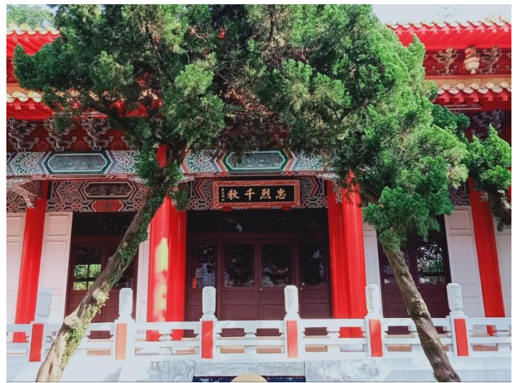
圖二 基隆神社日治後期完工模樣

神社造營奉贊會」遂於 1932 年將事務委由基隆市役所處理，最後經費的問題是向臺北借款解決，神社工程於 1934 年完工。神社完工後，隔年基隆市役所提出升格申請，之後於 1936 年列為縣社。