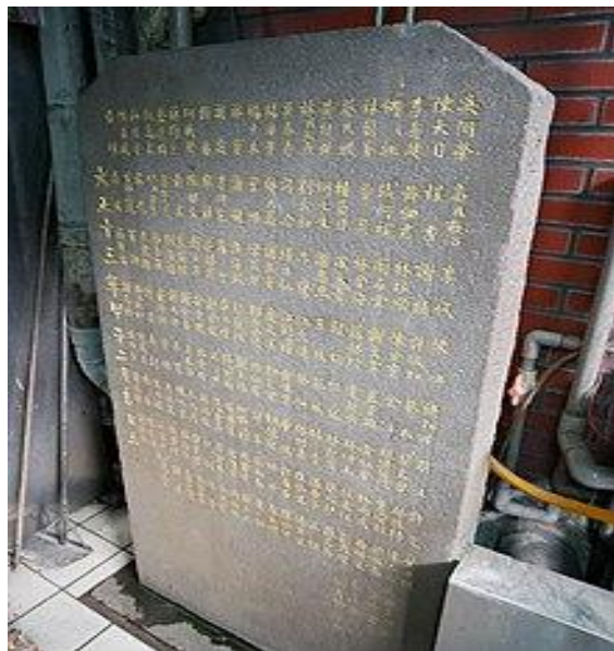
奠濟宮改築諸善信寄捐錄碑

已有百年歷史的奠濟宮位於基隆市最精華的商業區地段,原本已列入古蹟保存,後來因為當時的此市政府定有意對廟口攤位的動線重新規劃並改建為商業大樓,雖然解除了古蹟指定,卻遲遲沒有進行改建。雖不列入古蹟,但廟內還是有很多百年古物,例如主神旁兩根清同治年間的石柱,還有廟門口的百年石碑,皆值得一看。