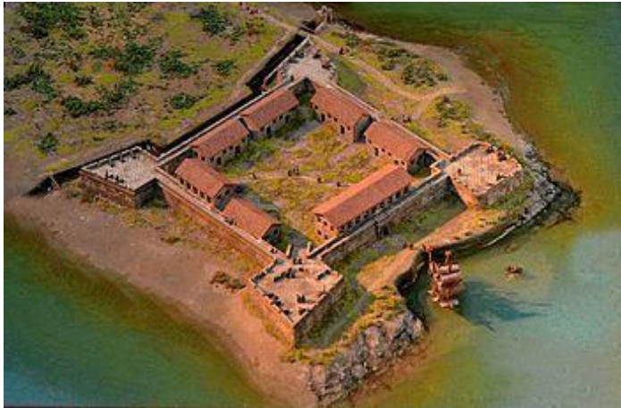
聖薩爾瓦多城假想圖[ http://gg.gg/g717h ]

聖薩爾瓦多城又叫做聖救主城，位置在台灣北部基隆社寮地區的和平島上。西班牙人於 1626 年登陸北台灣三貂角。