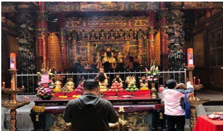
奠濟宮的開漳聖王神像

2月15日奠濟宮暨協辦單位一大早就會舉行祭典,下午則有遊境拜廟的活動,歌仔戲公演兩天,祈求風調雨順。