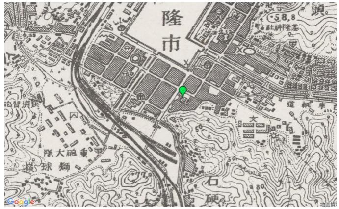
圖/日治時期的基隆吳家鼎邊銼 (擷取自台灣百年歷史地圖)

/https://www.tripadvisor.com.tw/Restaurant_Review-g13806823-d8687048-Reviews-Bainian_Wujia-Ren_ai_District_Keelung.html