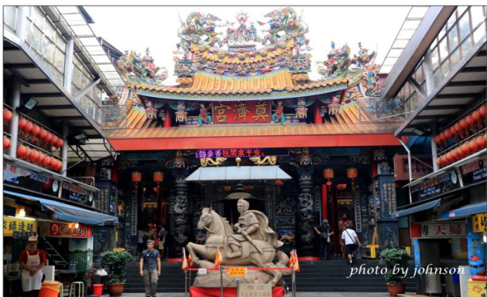
開漳聖王塑像

基隆廟口夜市的「廟」指的就是隱身在夜市中的奠濟宮,建於西元 1873 年,已有 130 多年的歷史,是一座百年古剎。為基隆市區最大型的廟宇,廟內供奉「開漳聖王」也就是唐朝的名將陳元光將軍。