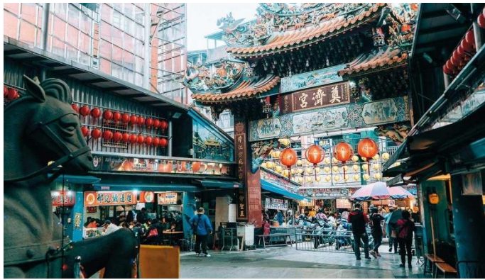
奠濟宮廟口 ( https://smiletaiwan.cw.com.tw/article/2396 )

(記者：李偲璇、李啟綺、林以恩、吳貫瑜、項子耀/基隆報導。)說到基隆廟口，不免都想到擁有百年歷史的吳家鼎邊銼。百年吳家鼎邊銼起源於一九一九年，是最早在基隆廟口經營小吃攤生意者之一，現在就讓我們一起去尋找美食吧！基隆三大廟之一的奠濟宮，建於同治十二年於基隆廟口，四周的小吃攤販，已是基隆市民生活的一部份，而在熱鬧的街道中，有一個百年老店叫做吳家鼎邊銼，這座已有百年歷史的名店，它現在已經有了數家分店，可以說是基隆廟口攤販們的老前輩呀！