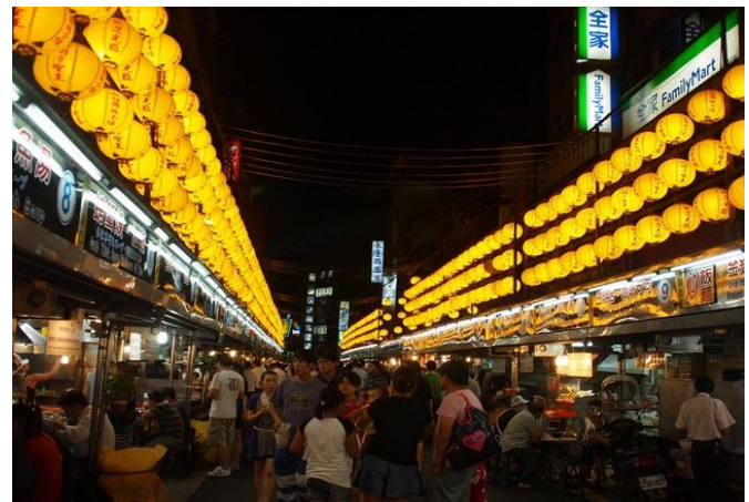
晚上時廟口熱鬧的景象

其實日治時代晚期，廟埕兩旁的房子已有固定攤販，廟埕中間也有以帆布搭成的臨時攤販。當時，基隆雖然只有五、六萬人口，但廟口一帶是商業中心，常有人潮，所以，才會從廟埕一直擴張到仁三路上。