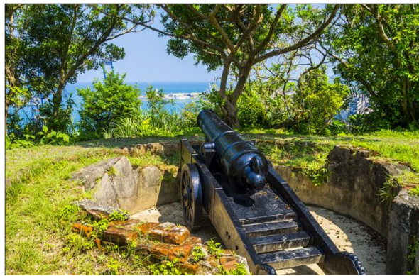
此為其中一座砲台，此外還存有大石階梯、彈藥庫，深受觀光者喜愛

該砲台現今已無軍事用途，但因為可俯視基隆港外港與一部分內港，因此成為觀光景點。另外也因具歷史人文價值，被列為中華民國國定古蹟。這就是歷史的傷痕，一個無法再次重演的故事，而基隆就是那傷痕。