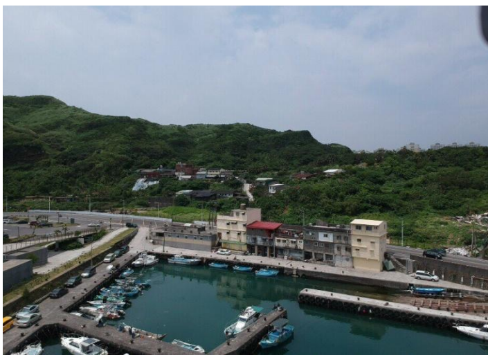
此圖為八斗子望海巷漁港

望海巷是一個座落於基隆市與新北市交界處依山傍海的小漁村，舊地名叫<換番>，是早期漢人與平埔族以物易物的地方，後來才改成望海巷。