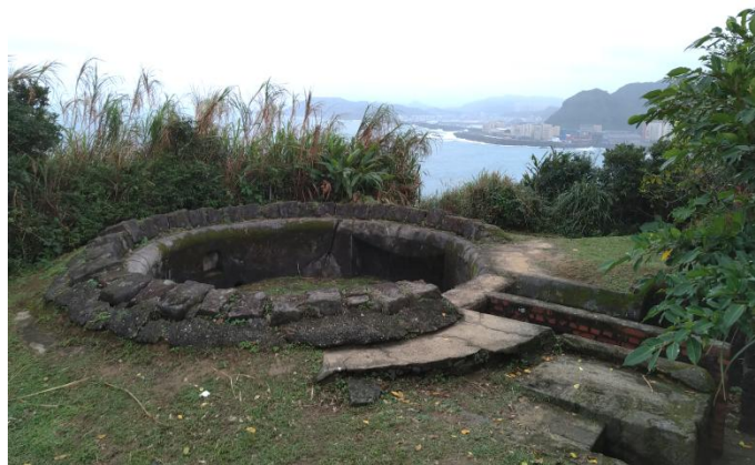
社寮砲台坐山望海，如此特殊的地理條件在許多場戰役中具有優勢

根據文獻記載，社寮砲台與白米甕砲台可保衛基隆港免受戰火摧殘，地勢極為險要，所以在眾多戰爭中具有很重要的地位。社寮砲台位於社寮島東邊山頂的最高點上，負責監控基隆港東側的海域，與社寮西砲台悠久的歷史不同，社寮東砲台創立於1904年為日軍進入後為因應戰爭所需的準備工事之一砲台，社寮東砲台除了殘存的砲座區外砲台已無法辨識，而其他的石砌建築仍有部分尚存