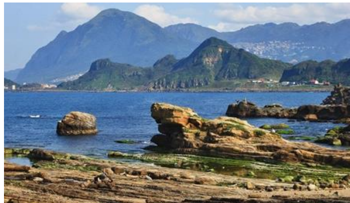
此圖為蟾蜍覆蚊

望海巷漁村左側 200 公尺處潮間帶上一處岩層，因形似一隻蟾蜍要吃蚊子，故取名蟾蜍覆蚊。