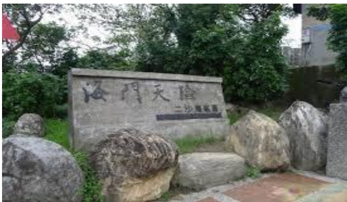
這個砲台在基隆港東，是觀光客最常來參觀的砲臺 海門天險

二沙灣砲台，又稱二沙灣礮臺，為一級國定古蹟，使用時期為 1840 年 - 1895 年，控制者是清帝國、日本帝國以及中華民國。由劉銘傳和姚瑩指揮興建，建於道光 20 年（西元 1841 年）。此砲台和鴉片戰爭、西仔反戰爭和乙未戰爭有關。