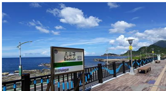
此圖為八斗子車站

整條鐵路早期從瑞芳到水濂洞，沿途碧海藍天，風光明媚，是水濂洞對外的交通要道，民國 67 年濱海公路開通後，部分路段停駛，僅剩瑞芳到深澳的運煤作業，民國 96 年深澳電廠除役後就全面停駛，直到海科館開始營運，加上新北市秘境-象鼻岩的熱潮，重新修整鐵道，轉行為觀光鐵路，設置八斗子車站，媲美東部多良車站，並發展鐵路觀光腳踏車，延伸鐵路至深澳，使遊客有更多新奇的體驗。