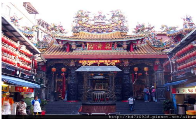
奠濟宮已有 100 年的歷史

在光緒元年攤販出現(1875)奠濟宮因此有香客出現就有攤販流動了。因為奠濟宮供奉的是開漳聖王所以附近大部分都是漳州人。「開漳聖王」是漳州的宗教信仰。百年來，緊鄰奠濟宮發展出來的小吃攤販區，吸引了無數食客，打響了「基隆廟口小吃」的名號，也成為基隆最重要的觀光資源。