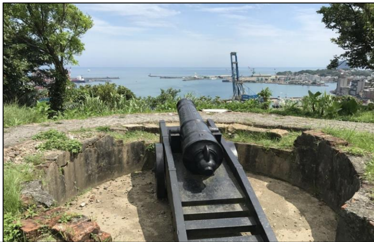
砲臺守護著基隆海岸

位處基隆市山坡地區區域的國定古蹟二沙灣砲台，經年累月受自然氣候影響，早已難如初期堅實，再加上近年公共設施(如快速道路、公園廣場)緊鄰關建，以及山坡坡角民間房舍違規侵建等，使得砲台城牆龜裂及坡地坍塌警訊發生多起；諸多警訊顯示管理上、法制面均有不足。因此，擬出維護國家重要文化資產的保育計畫。