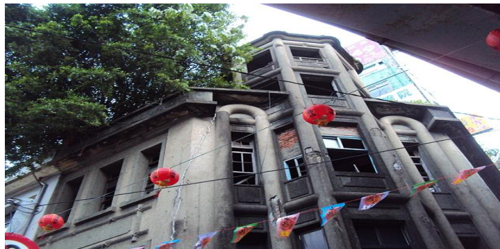
基隆 林開群洋樓 (倪蔣懷故居) @ 時空旅人:: 隨意窩 Xuite 日誌

儘管林開群洋房的靈異傳聞眾多，但根據學者研究，林開群洋樓之所以遲遲未拆除重建，純粹是因為林家產權複雜罷了。只不過林家後代子孫人數眾多，林開群去世後未將此屋產權交代清楚，加上林家後代皆經濟能力不錯，無人肯花心思去整頓，才會任其荒廢。如今政府朝著產權整合的方向前進，只希望它能夠重現往日風華。