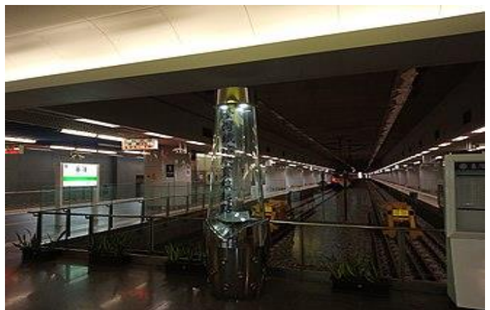
台灣鐵路縱貫線的里程碑 2015 年 6 月 29 日配合第五代基隆車站啟用