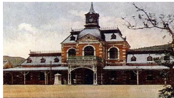
清朝時的火車站

台灣鐵路由清末台灣巡撫劉銘傳的統治下規劃和建造，從基隆通至台北，人民的來往更加方便。不過，因為台灣以前的經費不足，所以劉銘傳派人回大陸把鐵軌搬回台灣，數量不多，質料不佳，可以建造的路程不遠，也常常發生意外。由於路線標準極不理想，數座大橋又屢修屢壞，且劉銘傳所建的鐵路之軌道材質、設計施工，均不符使用需求，於是在後來的日治時期，基隆火車站便重新改建。