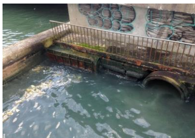
旭川河口的垃圾以及排放的泥沙