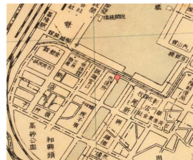
先前林家洋樓的位置

林家由於家族子嗣眾多，且產權並未仔細分清楚明白，雖然產權還在林家後代子孫手上，但林家後代子孫卻一點動作都沒有。而有些後代子孫卻覺得為何不和基隆市政府合作，變成基隆的網紅觀光景點，但後來因為後代子孫意見不合，這件和基隆市政府合作的事就不了了之。導致後來洋樓的發展、使用、外觀修建都遭到阻攔，以至於林家洋樓從『基隆海景第一豪宅』變成有名的廢墟，並且無人去關注、了解它，讓它變成臭名昭彰的「全台十大鬼屋之一」。現在若是要改變林家洋樓，首先要做最重要的是一整理好林家後代子孫的產權問題，才能繼續改變林家洋樓的所有問題。