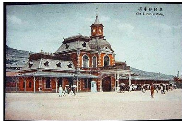
日治時期火車站

日治時期首任總督-山田憲典，要求幾名技術員檢查從基隆通至台北的鐵軌，發現許多鐵軌斷開、連接彎曲，保存得不好，山田憲典甚至在試乘重建前的鐵路時，火車的輪子被鐵軌的斷開處給卡住，又正好是在隧道中，讓山田憲典非常生氣，覺得台灣很窮，連鐵路都建不好。便於1899年，興建起南北鐵路，為了提前一年完工，多花了約3000萬的日幣，1904年，南部已經從高雄延伸到彰化，而北部從新竹一直延伸到三岔河(今苗栗縣三義)，在今日的中部地區成功彼此連結(所有的鐵路)。不過因為一些隧道的興建，直到了1908年才正式投入營運，為台灣的運輸業翻開新的一頁，也讓台灣的人民在搭車時更有安全感。