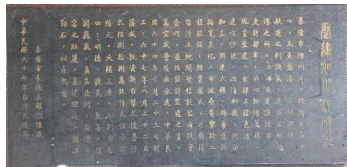
旭川河碑文，放置於孝一路和忠二路交叉口