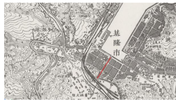
在日治二萬五千分之一地形圖上的旭川河，能看到尚未加蓋(為紅線部分)

第二次世界大戰後，基隆市區的面積開始擴張，但是由於基隆市區的平地面積狹小，基隆市區已經沒有更多的平地可以供給人開發了，於是在1959年，基隆市政府填平河床興建了東和大樓、警察局第一分局廳舍。由於旭川河於戰後日漸淤塞，失去了航運的功能，同時為了增加基隆市區可用的地方，以利於基隆市區繁榮。從此，一場與河爭地的戲碼，上演了三十餘年。而基隆市政府於西元1975年10月23日對旭川河開始進行非常大規模的整治工程，將整個旭川河加蓋起來，於西元1978年8月22日完工，並且於1980年興建了明德大樓和親民大樓還有至善大樓這三棟連通的大樓，並將原本住在旭川河岸的住戶遷入。