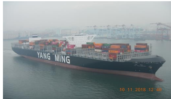
(陽明海運貨櫃船/網路)

管制、船隊的調派、船期的掌握、全球資訊網建置、貨源的掌握等，最後費盡心力終於把貨櫃運送到目的地，大功告成。