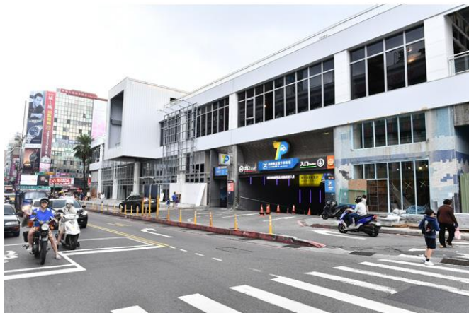
改建到一半的東岸

之前因為基隆廟口十分熱鬧，在假日時會吸引許多外來的遊客前來觀光，也因為有很多觀光客前來，停車就成為了非常嚴重的問題，所以到了後面，市長為了解決停車的問題，而填海造陸興建東岸停車場。