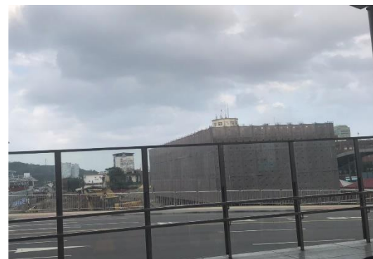
整修中的舊火車站

光復後，台鐵將車站開放的迴廊改成密閉式，建築材料則為紅磚和一些較上等的建材，變得比較牢固也比較好看一些。不過隨著基隆港慢慢的落沒，火車的班次遞減，四周不再是這麼繁榮了，讓基隆的政府和市民們感到 so sad，於是港務局和鐵路局便聯手復興火車站，將鐵路改為電氣化，看得出來台灣的工業已大幅的提升了!!!