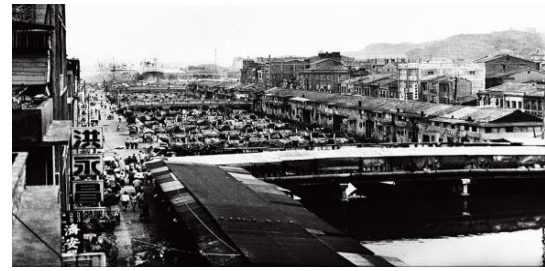
早期的旭川河，尚未加蓋

位於基隆市區的旭川河原名是明德河，為一條石硬港河下游的河道，而且炭仔頂漁市就是建於河畔。日據時期時，西定河下游開始了改道工程，改與南榮河的河道合流、改建成為運河，於1912年終於完工了。日本人參考了北海道的「旭川」，將此運河取名為「旭川河」，並開始設置人工挖掘的水道以及小型的碼頭。