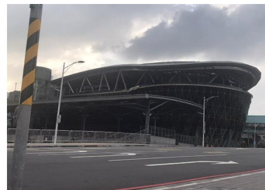
現在的新火車站

民國54年3月起(分三期)進行改建修成,左側改為鋼筋水泥建築,12月完工.二期與現今使用中的站房,於民國56年1月23日落成.面積達1220平方公尺,政府還花費大筆資金改建鐵路,使其變成半地下化,而且是座綠能的車站,是台灣第一座的綠能火車站,外型也與雞籠有關,外觀看似是船,其實是個籠子,車站的出口都和港口、市中心連接著,地理位置極佳,想必可以給一些外地的遊客留下好印象,饕客們也不要感到難過,改建後,把原本的客運站移除後,空氣品質以及四周的髒亂程度都降低了許多,引來不少店家在附近開店,歡迎大家常來基隆火車站喔!!!